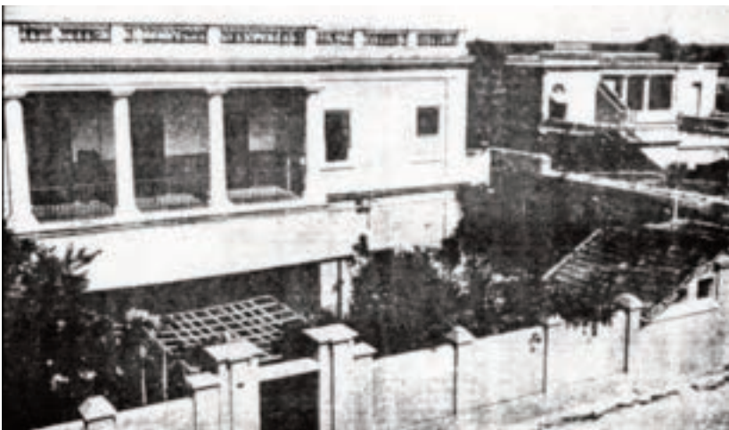
L'Ashram de Sri Aurobindo