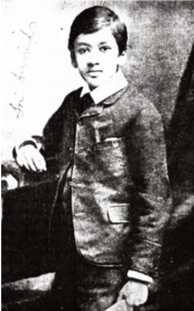
Sri Aurobindo à l'étranger