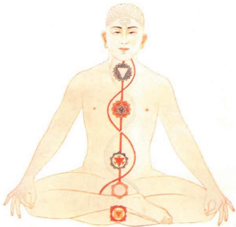
Les Six Chakras