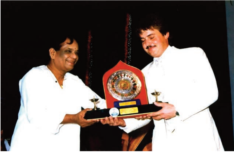
Padma Vibhushan Dr. Balamuralikrishna and Christian Piaget