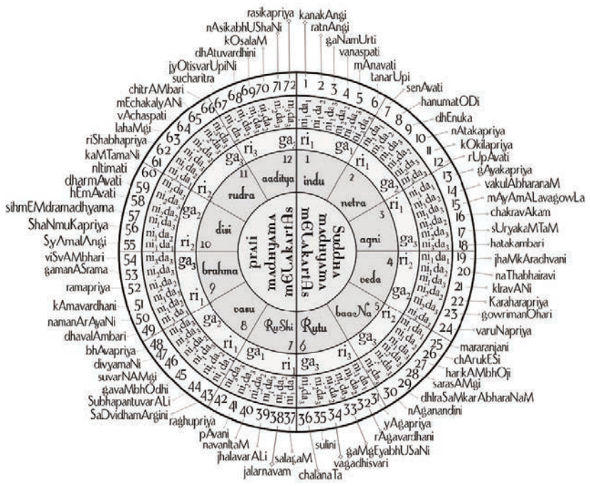
Le schéma des 72 Melakartha