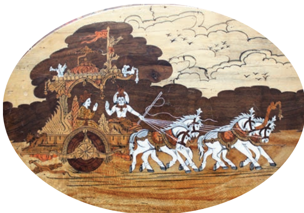
Sri Krishna et Arjuna