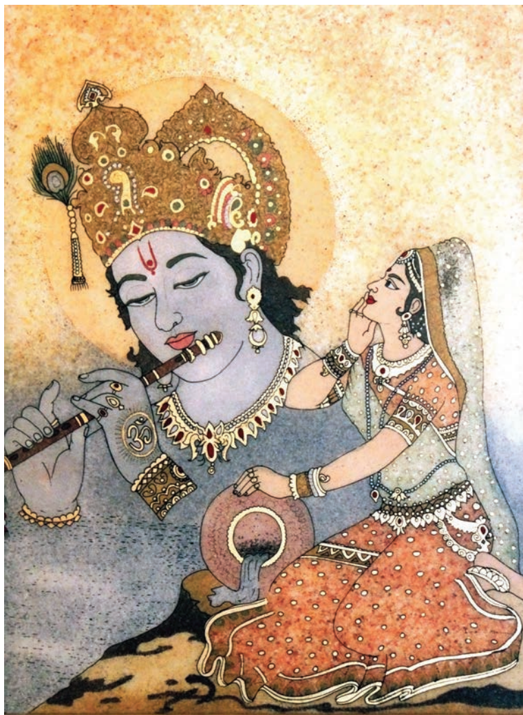
Sri Krishna et Radha